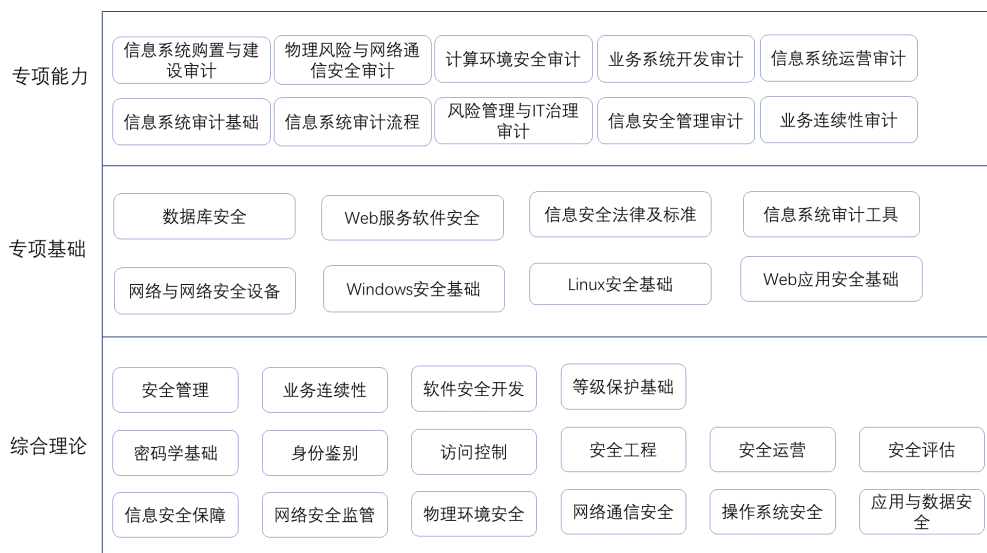
图 2 NISP-A （信息系统审计专项）知识体系结构

专项能力模块包括十个知识域，在理论考试和实操考试中会将此模块中的知识点作为考点。