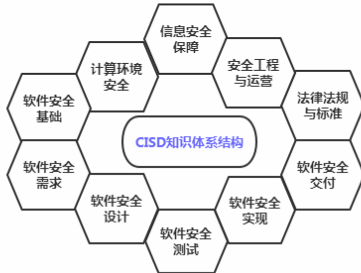
图 1：CISD 知识体系结构